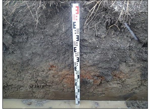
Kaapelikaivantoa Anian rantatien varrella, länsireunalla, valvotun osuuden pohjoisosassa, Kuvat etelään.

Nyt kaivetun kaapelikaivannon lounaispäässä vanha rakennus sijaitsee aivan nykyisessä tiessä kiinni, mistä johtuen kaapelikaivanto kaivettiin asfaltoidulle tielle vanha rakennus kiertäen.