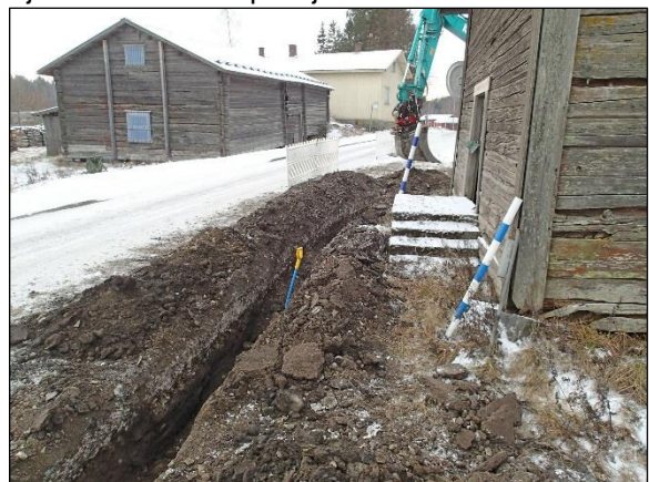
Oikealla: 18.12. kaivettua kaapeliojaa. Lapion kohdalle asti kaivettu määräsyvyyteen, lapiosta eteenpäin vain asfaltti ja sen alainen sora/hiekkakerros poistettu n. 50 cm syvyyteen, ehjän kulttuurikerroksen pintaan. Kuvattu lounaaseen.