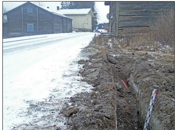
Vanha aittarakennus joka kierrettiin tein puolelta. Sen kohdalla ja yhtenäistä kulttuurikerrosta ja pohjoispuolella katkonaista kulttuurikerrosta joka tuhoutui kaapeliojaa kaivettaessa.